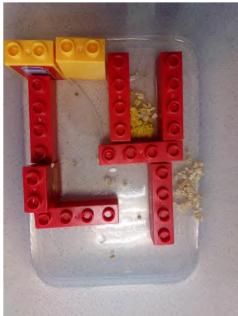
Déplacement dans un labyrinthe pour se nourrir