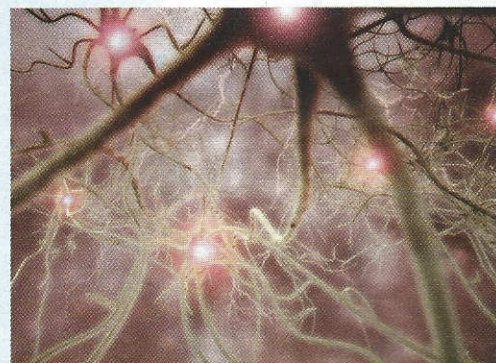
Neurones « La plasticité cérébrale se fige au sens très littéral à certains moments. »

structure d'accueil ne soit pas une simple garderie. Nous devons être très vigilants sur ce point. Ce qui compte n'est pas tant le caractère obligatoire de la scolarité que l'épanouissement des enfants. Je crois beaucoup, par exemple, aux activités proto-mathématiques, qui consistent à leur apprendre à mesurer, à trier, à construire, à créer des formes en deux ou en trois dimensions.