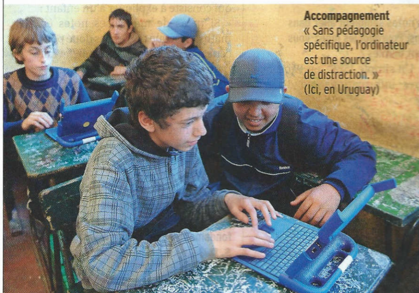
Accompagnement « Sans pédagogie spécifique, l'ordinateur est une source de distraction. » (Ici, en Uruguay)

S. D. Mon livre explique les avancées phénoménales de l'intelligence artificielle, mais aussi la manière dont elle diffère des algorithmes qu'emploie notre cerveau. Quand le logiciel AlphaGo a battu le champion du monde de jeu de go, j'y ai vu un jour historique. Néanmoins, le cerveau humain est encore loin d'être imité par les machines. Ce qui leur manque, c'est la capacité de formuler