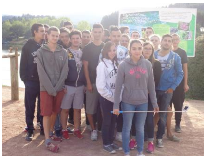
Pédalo & Accrobranche